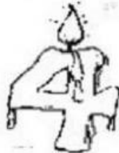
Mies S Trap 11