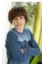
Mika H Trap 12