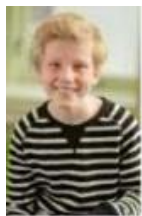
Kamiel S Trap 12,5

Daar is die dan, de nieuwe top 5 piepjestest december 2018! Ook bij de leerlingen die niet in de top 5 zijn gekomen, zijn er mooie scores behaald. Goed gedaan! In mei 2019 is de volgende. Blijf veel sporten en gezond eten! (gym) meester Marc