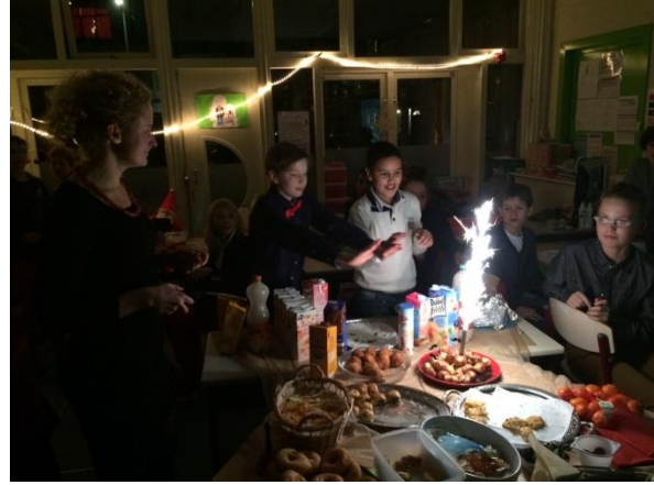
Kerstdiner in alle groepen. Op deze foto geniet groep 8 Noorderhavenkade van het kerstdiner.