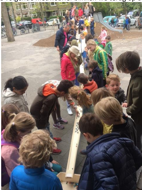
Groep 7 ontwerpt en oefent..

In de volgende nieuwsbrief blikken we terug op de racedag en maken we uiteraard de opbrengst bekend.