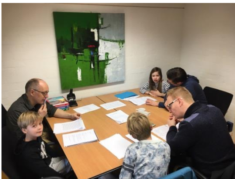
Het was een flinke klus voor de commissie.

Houd je ook van klimmen en klauteren? En heb je soms ook even een loopje nodig tijdens al dat werken? Heel veel kinderen vinden de pauze en de gymles zo fijn omdat ze dan even wat energie kwijt kunnen. Hoe fijn zou het kunnen zijn als je niet hierop hoeft te wachten maar gewoon op de gang even in de ringen kan hangen? Of kan klimmen tegen de klimmuur op? Wie weet slinger je straks wel via lianen naar de wc!