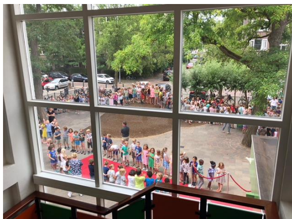
De rode loper en haag van leerlingen

Met een spetterende afscheidsavond in het Hofpleintheater hebben onze achtste groepers afscheid genomen van De Margriet. Afgelopen maandag om 15:00 uur was het dan echt zover. Op een rode loper en door een haag van 600 Margrietleerlingen verlieten de achtste groepers voor de laatste keer De Margriet. We wensen jullie heel veel plezier en succes in het voortgezet onderwijs, maar nu eerst een welverdiende vakantie!