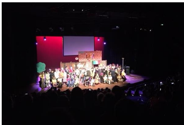
Het achtste groepie op het podium in Hofplein